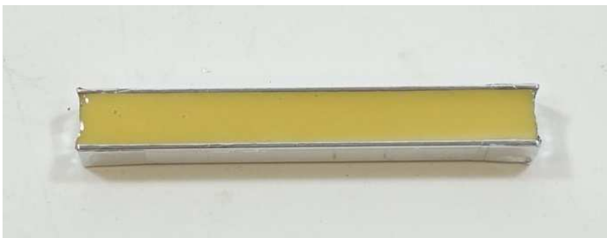
A001: BEPOX1000, Komponente A